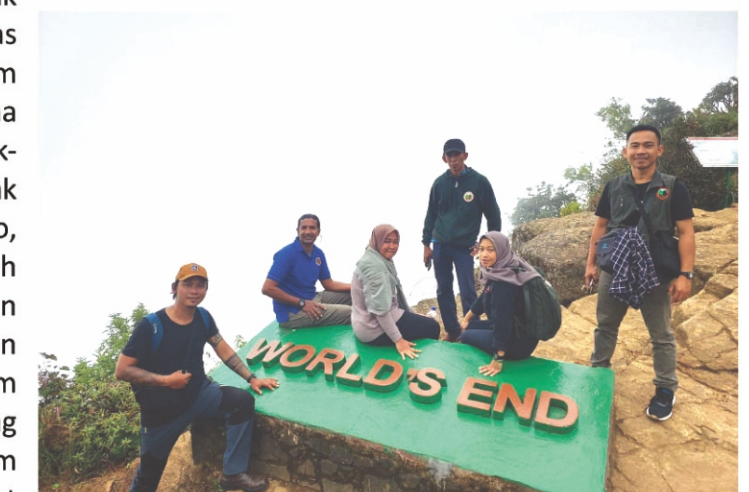
Kunjungan ke Taman Nasional Horton Plains.