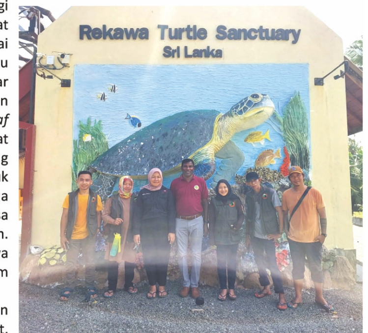
Kunjungan ke Rekawa.