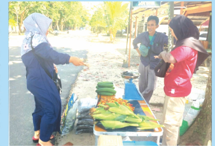
Mobile Market di Pantai Pulau Datok.

Kegiatan mobile market mulai sejak 2023, yang ditangani langsung staf bidang program Sustainable Livelihood . Kegiatan ini rutin setiap bulan dilaksanakan dimulai dari jam 07.00 – 16.30 WIB, yang berlokasi di sekitar pantai Pulau Datok. Kegiatan ini sudah mendapat izin dari Dinas Pariwisata, Kepemudaan, dan Olahraga (DISPARPORA) dan Dinas Pertanian Kabupaten Kayong Utara.