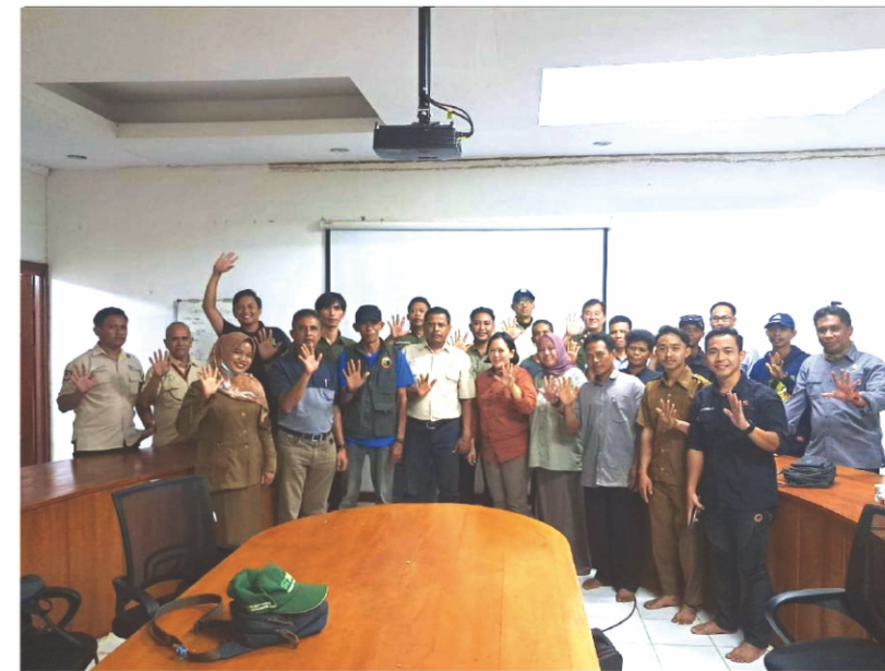
Jalin Kerjasama Kemitraan Konservasi bersama Multipihak.

Kegiatan rutin pendampingan Program Hutan Desa Yayasan Palung dalam pengelolaan kawasan hutan desa pasca izin adalah dengan memfasilitasi dan mendukung kegiatan yang dituangkan dalam Rencana Kerja Perhutanan Sosial (RKPS) dan Rencana Kerja Tahunan (RKT) setiap LPHD. Salah satu pendampingan yang terkait pengelolaan kawasan hutan desa diantaranya dengan mendampingi LPHD dalam kegiatan pengelolaan hutan sesuai dengan prinsip pengelolaan hutan Lestari, memfasilitasi LPHD dalam kegiatan penandaan batas areal kerja dan melaksanakan perlindungan serta pengamanan kawasan hutan desa dengan program SMART Patrol, memfasilitasi kegiatan restorasi dan reboisasi hutan di areal kerja LPHD, memberikan bantuan alat pemadam