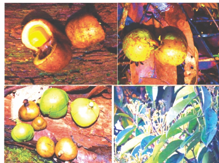
Bunga dan Buah di lantai Hutan Desa, Buah; Baccaurea (kiri atas) Tetramerista (kanan atas); Blumeodendron (kiri bawah), Bunga; Stemonurus (kanan bawah), Source; (photograph by; G. Wibisono, source; YP).