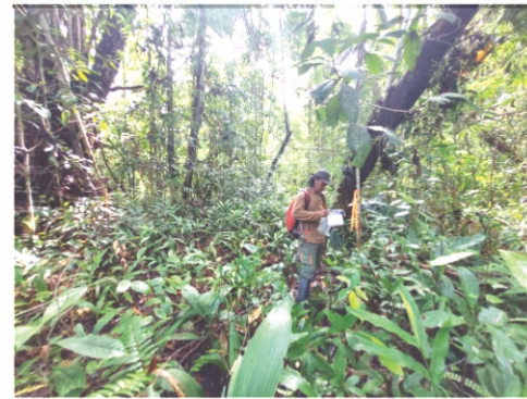
Anggota Tim Survei Biodiversitas Mengumpulkan Data Lapangan (Dok. Yayasan Palung).