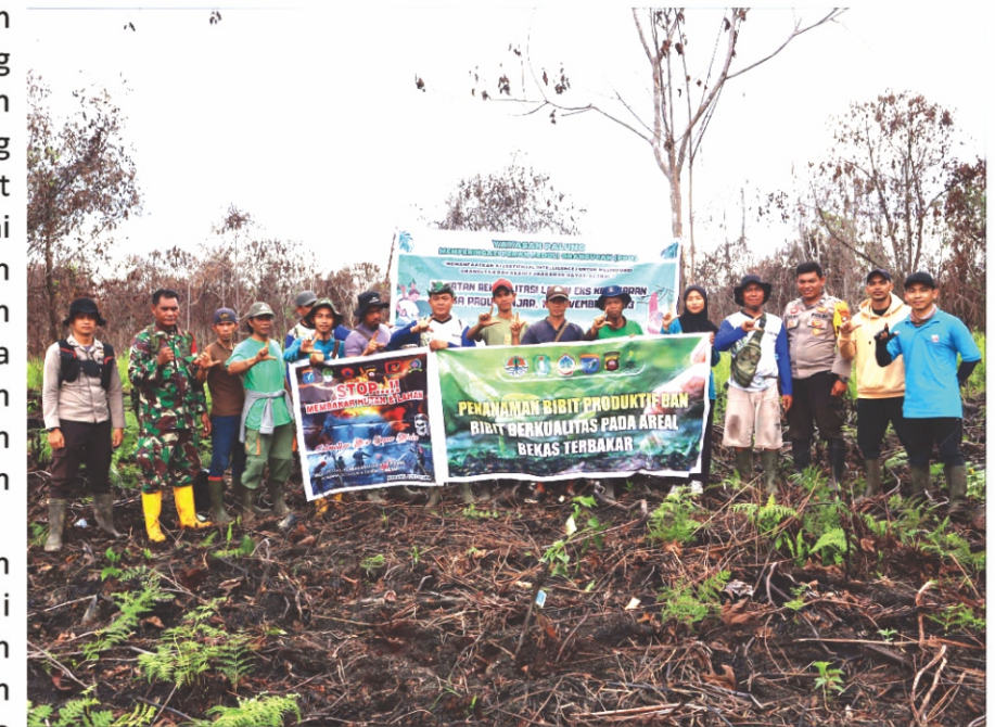
Kegiatan Penanaman Bibit Pada Area Bekas Terbakar.

Melalui kerja sama Perhutanan Sosial, masyarakat diajak untuk berpartisipasi aktif dalam pengelolaan hutan. Ini menciptakan rasa memiliki dan tanggung jawab terhadap lingkungan sekitar, karena mereka dapat merasakan dampak langsung dari kebijakan dan tindakan yang mereka ambil Kewenangan LPHD untuk melakukan kerjasama multipihak, disebut jelas dalam Peraturan Menteri LHK Nomor 9 Tahun 2021 Tentang Pengelolaan Perhutanan Sosial Pasal 113, menyebutkan bahwa selain dapat memiliki akses kelola hutan dan lahan, LPHD sudah ditempatkan sebagai pelaku utama atau subjek, dan penerima manfaat dalam pengelolaan hutan yang lestari untuk sebesar-besarnya peningkatan ekonomi masyarakat yang merata. Kelembagaan yang