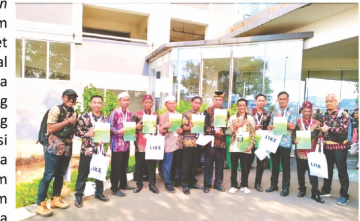
Menerima SK Pengelolaan HD Lubuk Batu.

Yayasan Palung atau Gunung Palung Orangutan Conservation Program (GPOCP) memiliki 2 (dua) program utama yakni riset dan konservasi. pada program riset fokus area kerjanya adalah di kawasan Taman Nasional Gunung Palung sedangkan pada program konservasi area kerja berada di luar kawasan inti Taman Nasional Gunung Palung yang terletak didua kabupaten yaitu Kab. Kayong Utara dan Kab. Ketapang. Pada program konservasi terbagi lagi menjadi beberapa program diantaranya Program Pendidikan Lingkungan (PL), Program Perlindungan dan Penyelamatan Satwa (PPS), Program Sustainable Livelihood (SL), dan Program Hutan Desa (HD). Empat program Yayasan Palung tersebut memiliki keterkaitan yang erat, artinya setiap program selalu saling melengkapi dan memiliki peran masing-masing dalam upaya konservasi orangutan dan habitatnya.