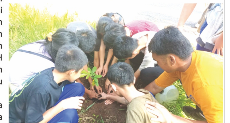
Penanaman Pohon.