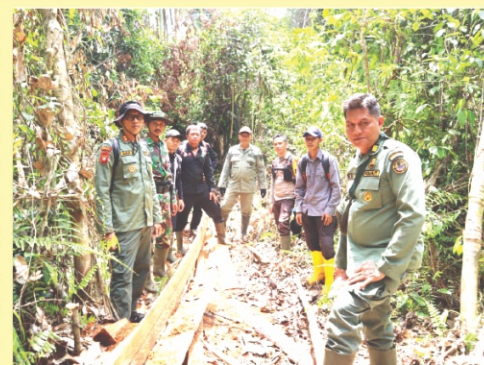
Temuan Patroli Bersama pemangkat.

Selanjutnya, pihak pemerintah bersama Yayasan Palung dan LPHD Pemangkat menindaklanjuti kasus ini dengan memanggil terduga pelaku pembalakan diresourse KPH wilayah kayong Desa Pemangkat untuk diberikan surat peringatan dan pernyataan. Pelaku memenuhi panggilan dari tim gabungan untuk datang ke resource, setelah dialog panjang dengan