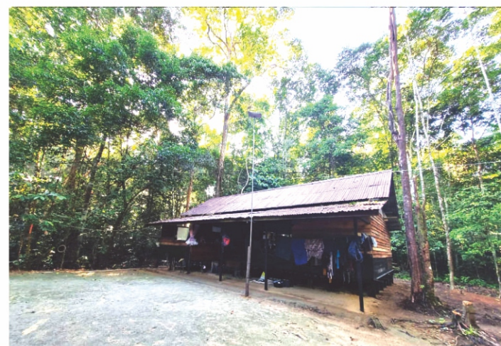
(Kiri) Staf YP Berfoto Bersama Cheryl di Depan Camp Sungai Rangkong (Kanan) Bangunan Camp di Sungai Rangkong