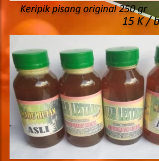
Madu Hutan 200 ml 60 K / btl