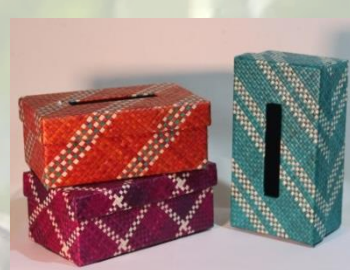
Tempat tissue 25 cm x 15 cm 80 K / pcs