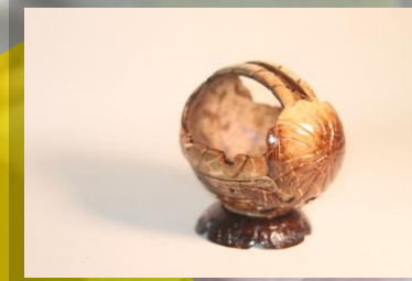
Asbak rokok 50 K / pcs