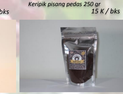
Kopi bubuk kopi jaya 100 gr 10 K / bks