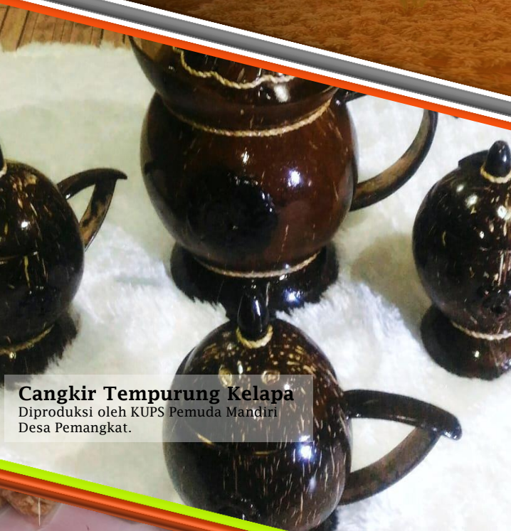
Cangkir Tempurung Kelapa Diproduksi oleh KUPS Pemuda Mandiri Desa Pemangkat.