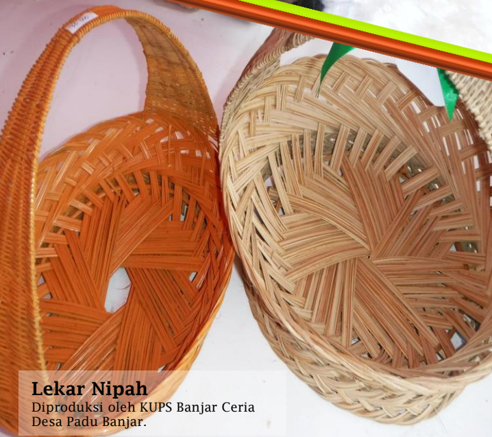
Lekar Nipah Diproduksi oleh KUPS Banjar Ceria Desa Padu Banjar.