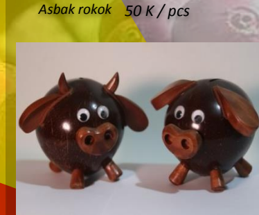
Celengan babi 60 K / pcs