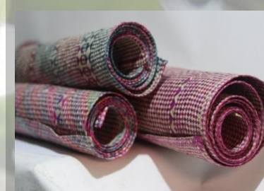
Tikar Pandan 150 cm x 75 cm 120 K / pcs