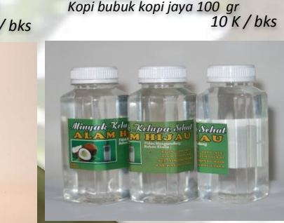
VCO 200 ml 35 K / btl