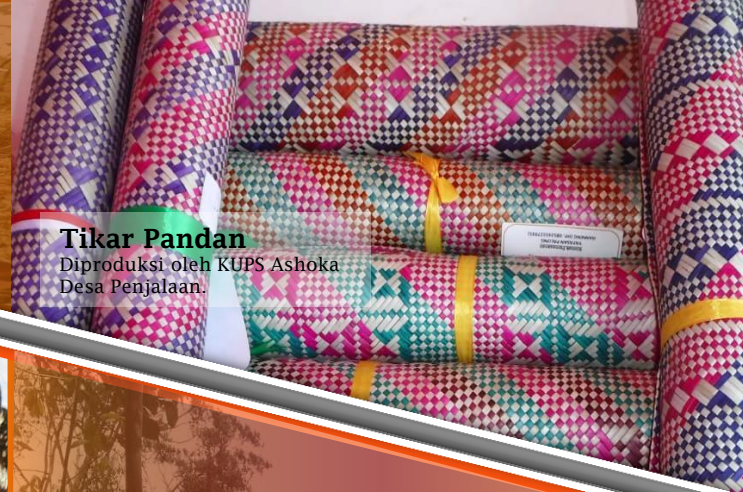
Tikar Pandan Diproduksi oleh KUPS Ashoka Desa Penjajalan.

Hutan desa adalah hutan negara yang dikelola oleh desa dan dimanfaatkan untuk kepentingan desa. Dengan program hutan desa ini masyarakat sekitar kawasan hutan menjadi merasa memiliki dan turut serta menjaga kawasan hutan termasuk ekosistem di dalamnya. Pemanfaatan Hasil Hutan Bukan Kayu (HHBK) di dalam dan di luar kawasan hutan desa diberikan kepada Kelompok Usaha Perhutanan Sosial (KUPS) atas binaan Lembaga Pengelola Hutan Desa (LPHD). Saat ini terdapat 5 LPHD dan 18 KUPS yang di Bina oleh Yayasan Palung.