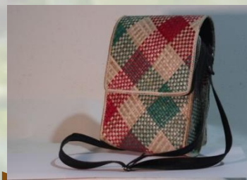
Tas pandan 25 cm x 20 cm 120 K / pcs