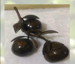
Buah tiruan dari tempurung kelapa 150 K / set