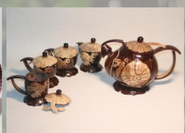
Cerek Tempurung Kelapa 250 K / set