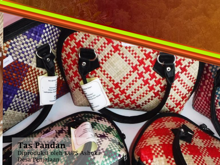
Tas Pandan Diproduksi oleh KUPS Ashoka Desa Penjajalan.

Hutan desa adalah hutan negara yang dikelola oleh desa dan dimanfaatkan untuk kepentingan desa. Dengan program hutan desa ini masyarakat sekitar kawasan hutan menjadi merasa memiliki dan turut serta menjaga kawasan hutan termasuk ekosistem di dalamnya. Pemanfaatan Hasil Hutan Bukan Kayu (HHBK) di dalam dan di luar kawasan hutan desa diberikan kepada Kelompok Usaha Perhutanan Sosial (KUPS) atas binaan Lembaga Pengelola Hutan Desa (LPHD). Saat ini terdapat 5 LPHD dan 18 KUPS yang di Bina oleh Yayasan Palung.