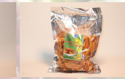
Keripik pisang pedas 250 gr 15 K / bks