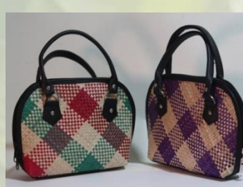
Tas pandan 30 x 25 cm 120 K / pcs