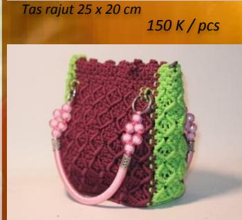
Tas rajut 25 x 20 cm 150 K / pcs