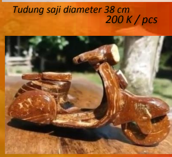
Miniatur motor 75 K / pcs