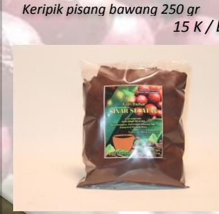
Kopi bubuk Sinar Selatan 350 gr 20 K / bks