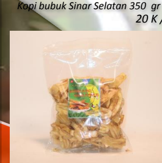
Keripik pisang original 250 gr 15 K / bks