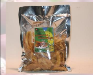
Keripik pisang bawang 250 gr 15 K / bks