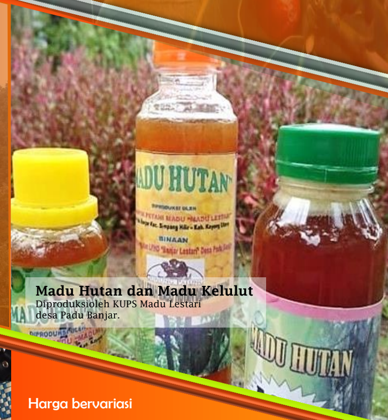
Madu Hutan dan Madu Kelulut Diproduksioleh KUPS Madu Lestari desa Padu Banjar.