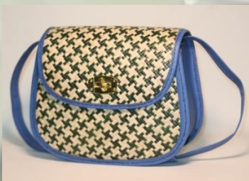
Tas pandan 30 x 25 cm 120 K / pcs