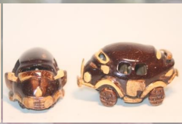
Miniatur mobil 75 K / pcs