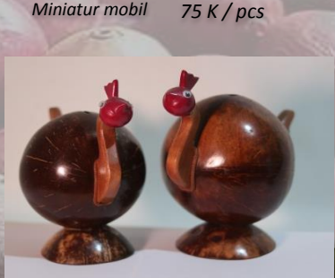
Celengan burung 60 K / pcs